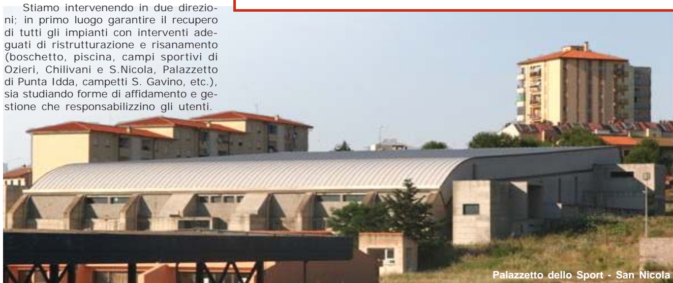
Palazzetto dello Sport - San Nicola

In coerenza con tale impostazione ha in particolare sottolineato l'esigenza di una migliore distribuzione degli svincoli e di un più razionale collegamento della nuova Sassari Olbia con la SS 131, via Mores, con il Goceano e con l'Anglona.